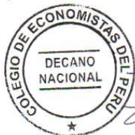
Econ. Arturo Corrales Espinoza Decano Nacional Colegio de Economistas del Perú